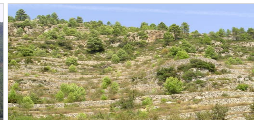
Avellaners de secà en bancals sostinguts per marges de pedra al vessant sud del puig de la Font. Molts d'aquests conreus s'han abandonat a favor dels més rendibles.