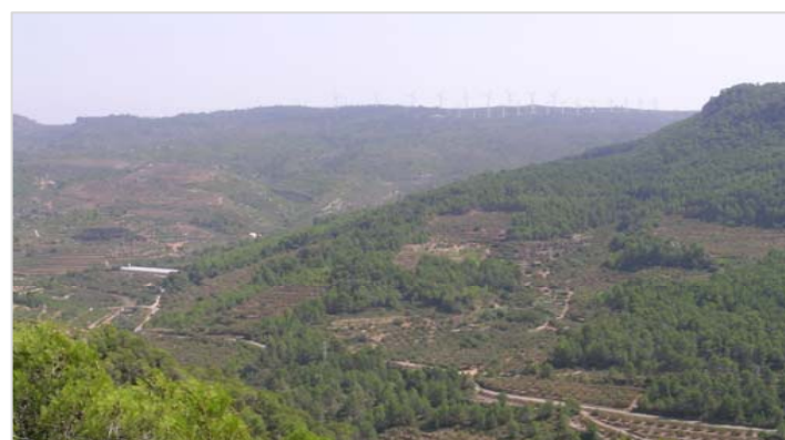
Vista general de la serra de Pradell, des de la N-420. Destaquen els conreus d'avellaners i fruiters de regadiu al fons de la vall, així com els aerogeneradors a la carena culminant.