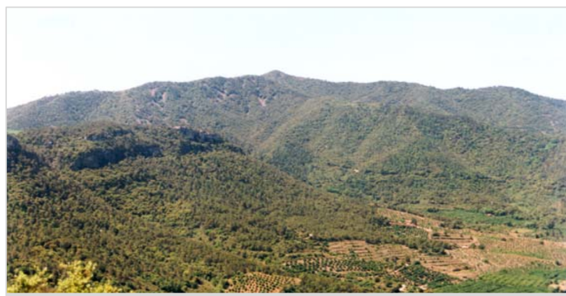
Panoràmica de la serra del Molló, des del serrat dels Colls, a la pista d'accés a Arbolí. Els vessants de la muntanya es cobreixen d'un alzinar muntanyenc poru ben conservat