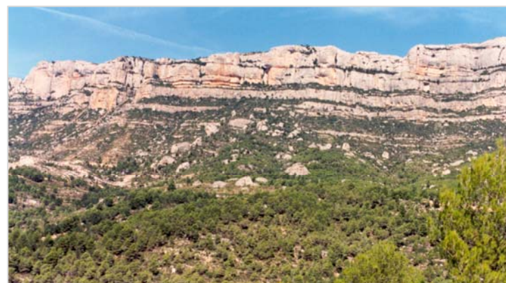
Cingle Major de Montsant, des del camí del mas de Sant Blai. Aquesta és una de les estampes paisatgístiques més conegudes i valorades de la comarca.