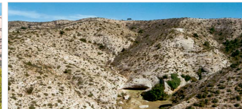
El paisatge del planell culminant de la serra Major reflecteix les dures condicions geoclimàtiques d'aquest espai. Un substrat format per conglomerats massius molt durs, unit a un clima oromediterrani continental possibiliten només la implantació d'una bosquina esclarissada. tot i que al fons dels clots i els comellars la vegetació és més exuberant.