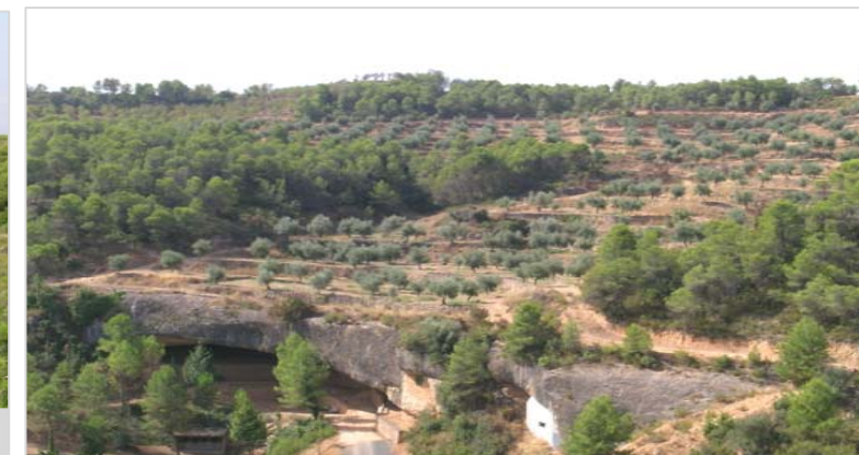
Bancals d'oliveres al damunt de la cova de Santa Llúcia, a la Bisbal de Falset, un indret de devoció popular i que va servir d'hospital militar durant la guerra civil..