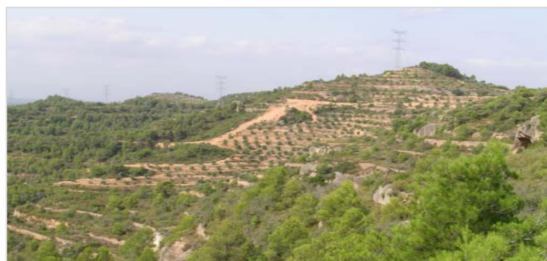
Vista general de la serra de Gorraptès, des del camí rural de la Bisbal a Bellaguarda. Aquesta alineació configura el límit entre el Priorat i la Ribera d'Ebre. Hi sovintegen els bancals d'oliveres entre els fragments de pinedes i carrascars.