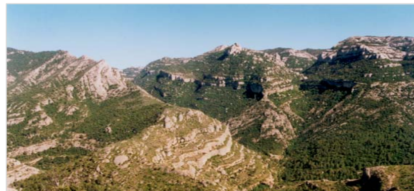
Al vessant nord de Montsant destaquen els barrancs profunds que tallen els conglomerats del massís i que condueixen les seves aigües al riu Montsant. La imatge, presa des del camí rural de l'Escambell, se centra en l'aiguabarreig del barranc dels Pèlacs amb el riu.