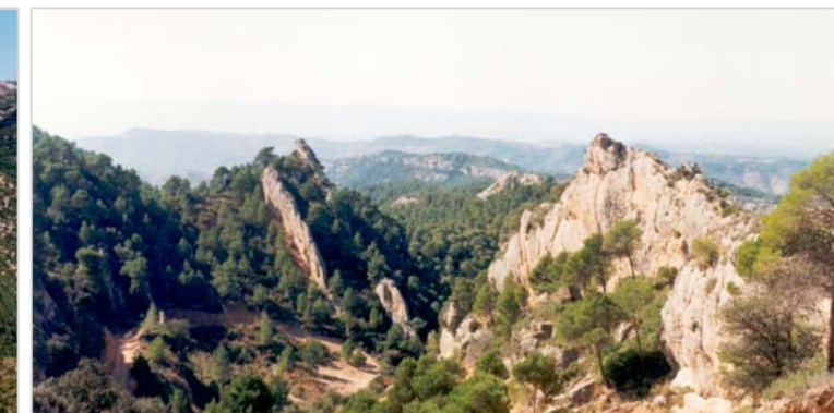
A ponent, els estrats s'orienten verticalment com a conseqüència dels moviments orogènics i l'erosió posterior origina les curioses crestes de conglomerat. Racó de la Foia, al damunt de Cabassers i molt a prop de l'ermita homònima.