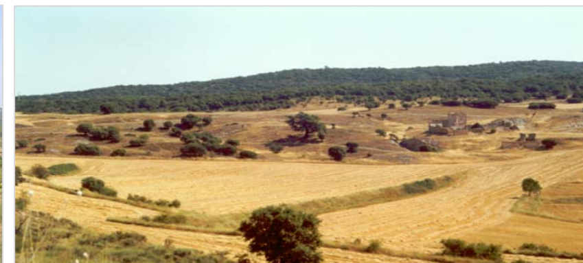
Als Segalassos, altiplà al vessant dret de la vall del Silenci, el particular microclima continental proporciona un paisatge que recorda al de la meseta castellana, amb sembrats i carrascars. La imatge està presa des de la carretera T-701.