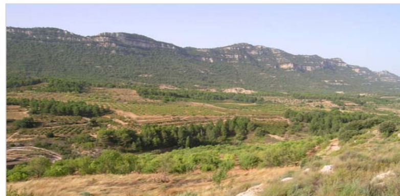
La Vall del Silenci, des de la C-242. Als fondals hi sovintegen els conreus de cereals i fruiters de secà, mentre que un bosc espès de pins de muntanya i caducifolis cobreix l'obaga d'Ulldemolins, al fons.