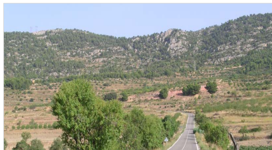
Panoràmica, des de la C-242 a la sortida d'Ulldemolins, de les Crestes de la Llena, alineació orogràfica que marca el límit nord-oriental del Priorat.