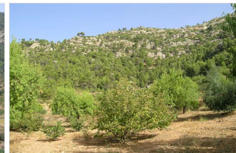
A la base de la serra de la Llena encara perviuen alguns bancals d'avellaners, ametllers i oliveres, com aquest, sota la punta del General, al costat de la C-242.