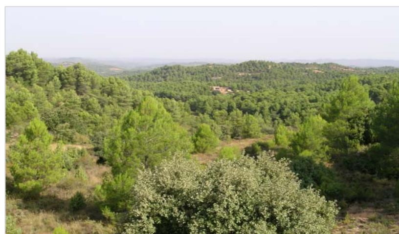
Barranc del purgatori amb el Mas del Roig, al centre de la imatge. A la part alta de les Garrigues els pins i les carrasques dominen el paisatge. Panoràmica des de la C-242.