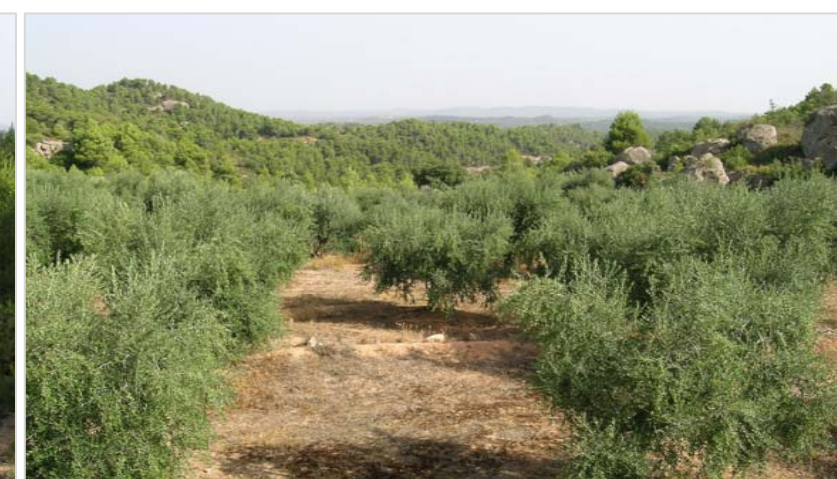
L'olivera és el conreu més estès a la unitat de les Garrigues d'Ulldemolins plantat en bancals que ocupen els fons dels comellars, com aquest, a prop del Mas del Tura.