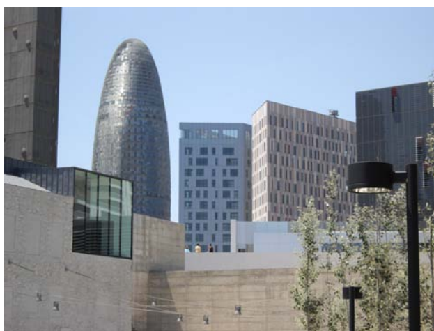
FIG. 2 La ciutat contemporània està en constant evolució. La transformació d'antics teixits industrials en un districte del coneixement (22@-Barcelona) són l'exemple d'aquests canvis en el paisatge urbà del segle XXI Autor: Albert Cortina