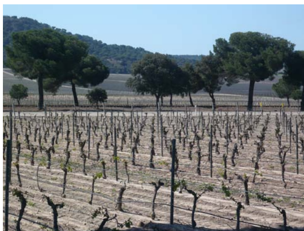
FIG. 5 El paisatge vitivinícola constitueix un important actiu del territori on el sector agrari, productiu i de serveis s'interrelacionen a favor de la identitat del lloc i de la qualitat de vida de les persones.

En aquest sentit, poden impulsar l'elaboració de les cartes del paisatge, el Govern de la Generalitat de Catalunya, els consells comarcals, les mancomunitats de municipis, els ajuntaments i les altres administracions locals.