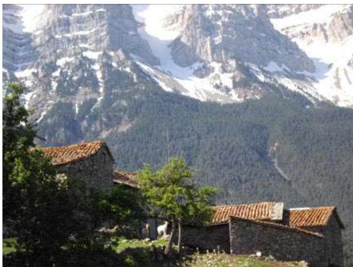
FIG. 3 La coordinació entre les polítiques de paisatge i les polítiques sectorials donen com a resultat la dinamització dels paisatges rurals i d'alta muntanya del nostre país. Autor: Albert Cortina