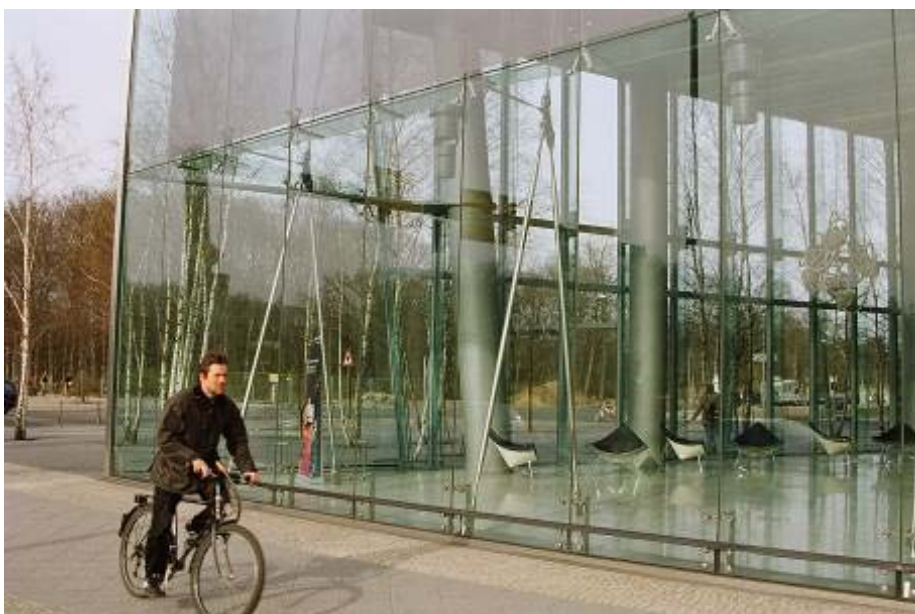
FIG. 6 La integració entre arquitectura avançada, espai públic de qualitat i mobilitat sostenible constitueix un dels principals reptes de les polítiques de paisatge urbà a les nostres ciutats Autor: Albert Cortina

Amb la finalitat d'orientar i facilitar l'elaboració dels EIIP el Departament de Política Territorial i Obres Públiques ha editat una Guia d'estudis d'impacte i integració paisatgística que presenta una proposta metodològica i exposa diversos estudis de cas.