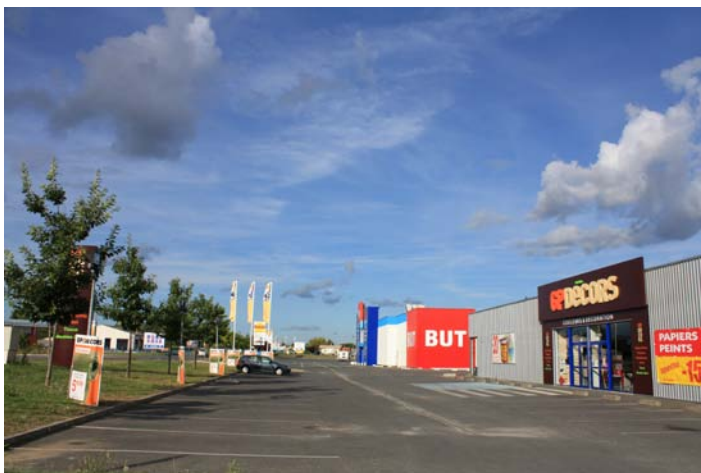
FIG. 4 Un dels grans reptes de les polítiques de paisatge i de la planificació territorial i urbanística es l'ordenació dels usos periurbans que sovint banalitzen els llocs i conformen una imatge desendreçada de les entrades als nuclis urbans Autor: Albert Cortina

Correspon al Departament de Política Territorial i Obres Públiques de la Generalitat de Catalunya elaborar la proposta de directrius del paisatge i incorporar als plans territorials parcials i, en el seu cas, als plans directors territorials, pel que fa referència al seu àmbit, les directrius del paisatge que corresponguin a les propostes dels objectius de qualitat paisatgística que contenen els catàlegs del paisatge..