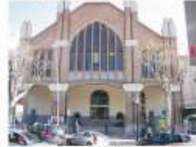
22. Instal·lació de banca a la porta del Mercat Municipal. 1.000 €

Consulteu la informació de tot el procés al web de l'Ajuntament: www.arenysdemar.cat