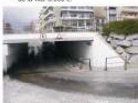
18. Barrocació de les beranes del túnel per anar a la platja i de l'ascensor. 7.000 €