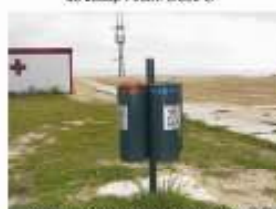
19. Instal·lació de 50 papereres en diversos espais de la vila. 7.000 €