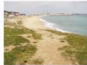
16. Millorar l'accés a la platja des del Carril de Mar. 8.000 €