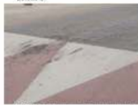
11. Passos elevats per minvar la velocitat dels cotxes (Pla dels Faros). 12.000 €