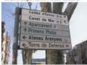
9. Col·locació de cartells indicadors de les instal·lacions del municipi. 12.000 €