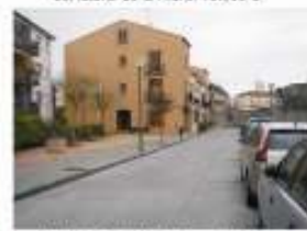
12. Arranjament del carrer i la plaça Joaquim Ruyra i Homs. 10.000 €