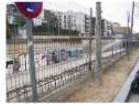
8. Canvi de la reixa metàl·lica del lateral de la Riera. 15.000 €