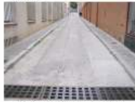
7. Pavimentació del carrer Sant Roc. 20.000 €