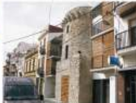
14. Retolació dels edificis emblemàtics de la vila. 8.000 €