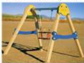
13. Dues gronxadors de cistella per a infants. 8.000 €