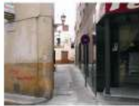
3. Rehabilitació del carrer d'en Goday. 45.000 €