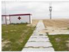
6. Instal·lació de 100 m. de passeres a les dutxes de la platja. 20.000 €