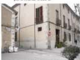
17. Senyalització del pas de vianants i senyalització barriètrica del carrer d'Avall amb la Riera. 8.000 €