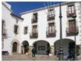
2. Il·luminació d'edificis històrics de la vila. 45.000 €