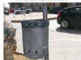
20. Instal·lació de papereres a les platges tot l'any. 4.000 €