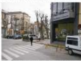
21. Il·luminació a l'altura del número 1 del carrer de Sa Clavella. 2.000 €

Del 5 al 13 d'abril, escull les 7 obres que creguis que són més importants.