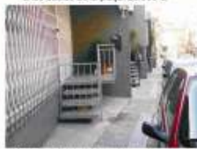
10. Arranjament de la vorera del carrer Anselm Clavé, 62-64-66. 12.000 €