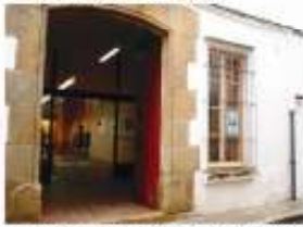
5. Rehabilitació de les façanes dels museus de Mineralogia i de les Purtes. 30.000 €