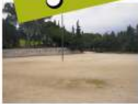
1. Arranjament Plaça de la Sardana del Parc de Lourdes. 50.000 €