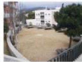
4. Arranjament de la plaça Bailevista. 30.000 €